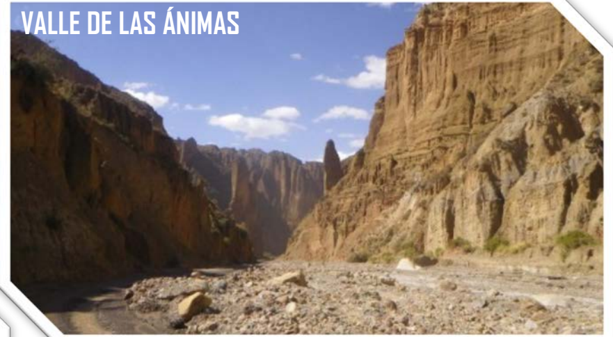
VALLE DE LAS ÁNIMAS